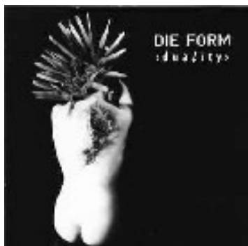
DIE FORM « Duality » (1997, Trinity-TRI 004 CD)